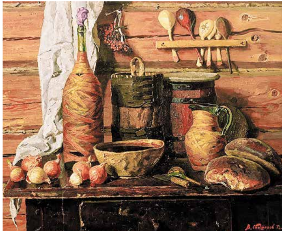
Владимир Стожаров. Натюрморт. 1972 год

Среди традиционных блюд – мтыква, постные виды чорбы (супа) и мамалыга – круто заваренная каша из кукурузной муки.