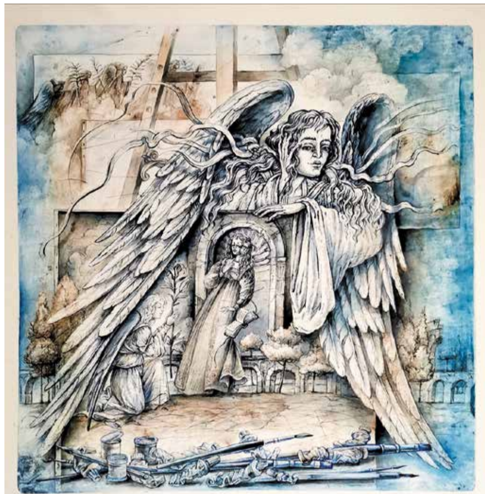
Вера Станишевская. «Студия II», акварель, перо 2021