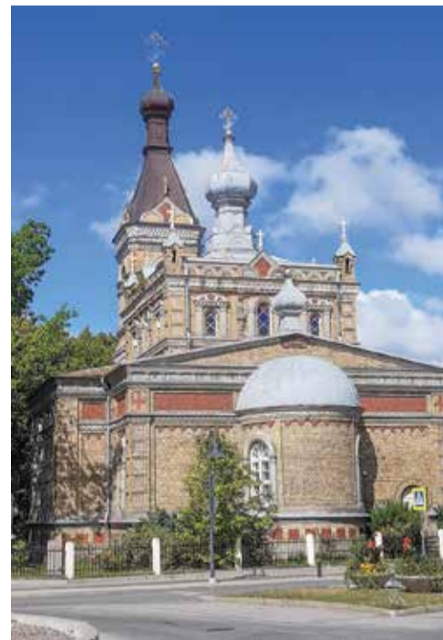
Преображенский храм в Пярну