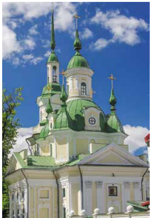
Екатерининский храм в Пярну

ских крестьян всё, что у них было: землю, права человека, возможность для культурного развития. Эти выступления оказали значительное влияние на атмосферу политической жизни в Эстляндии и Лифляндии, стали важным стимулом для пробуждения эстонского народа.