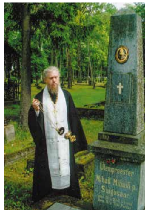
Отец Иона у могилы протоиерея Михаила Суйгусаара

Протоиерей Михаил Суйгусаар был похоронен на старом кладбище города Пярну. Через десять лет после его кончины на могиле был установлен памятник на средства, собранные со всей Эстонии.