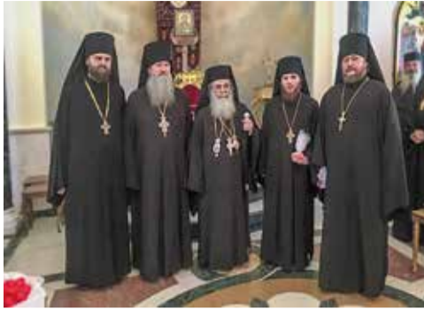
Русская миссия с Патриархом Феофилом

Миссия была учреждена 11 февраля (23 февраля по новому стилю) 1847 года по инициативе Императора Николая I для содействия укреплению Православия в Святой Земле, поддержания братских