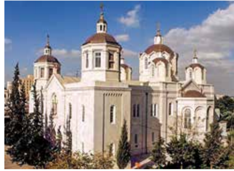
Иерусалимский Троицкий собор Русского подворья

отношений с Иерусалимской Православной Церковью и помощи русским палом-