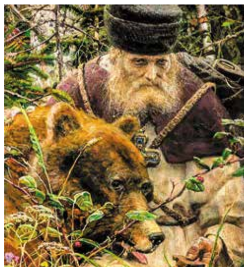
«Преподобный Серафим». Центральная часть триптиха

Преподобный Андрей Ослябя Послушник Троице-Сергиевой Лавры, принявший великую схиму (совершенное отчуждение от мира ради единения со Христом). По благословию Преподобного Сергия Радонежского прп. Андрей вы-