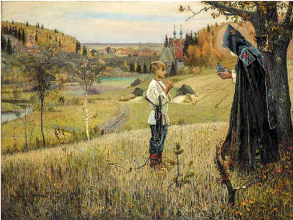
«Видение отроку Варфоломею»

Монархисту по убеждениям, Михаилу Васильевичу Нестерову пришлось жить в иной России — не царской. И хотя советская страна высокими регалиями и званиями отметит талант великого художника (заслуженный деятель искусств РСФСР, лауреат Сталинской премии первой степени...), но он до самой своей смерти так и не перестанет тосковать по той светлой тишине, которой была наполнена Святая Русь на его лирических полотнах.