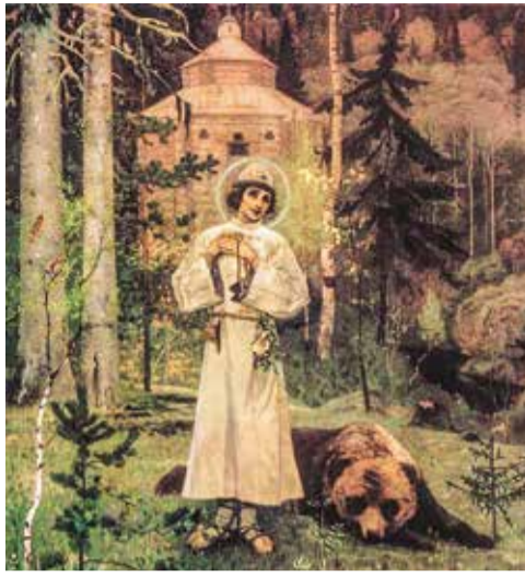
«Юность преподобного Сергия»

через пятьдесят лет после моей смерти он ещё будет что-то говорить людям — значит, он живой, значит, жив и я».