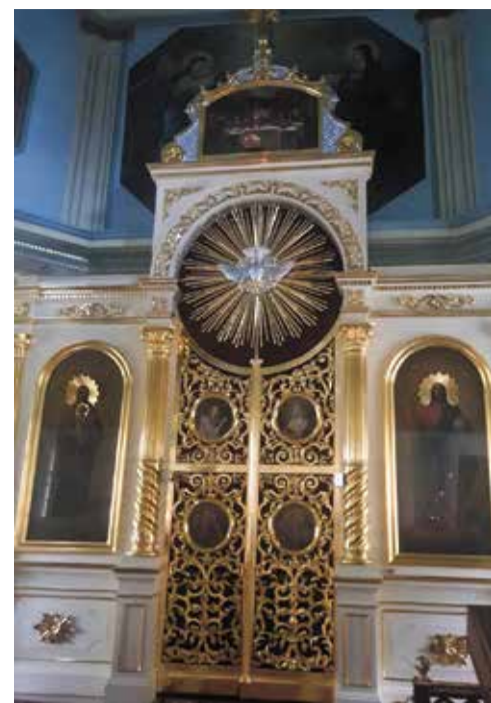
Царские врата.

Своё 300-летие храм Рождества Пресвятой Богородицы встретит