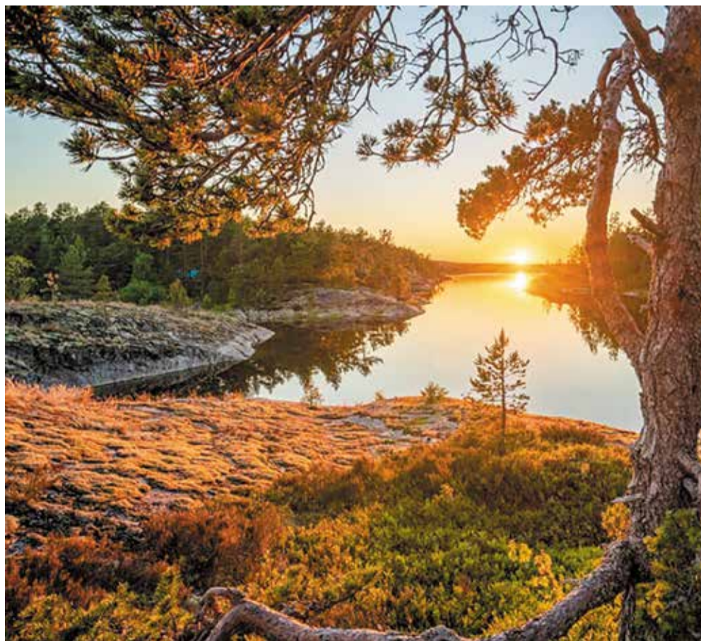
Фотографии Андрея Базанова, Санкт-Петербург