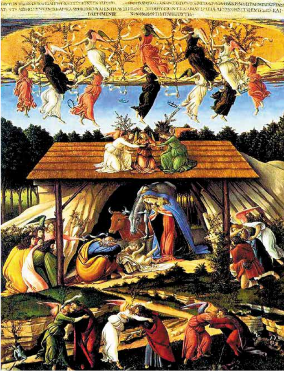
Сандро Боттичелли «Мистическое Рождество», 1500