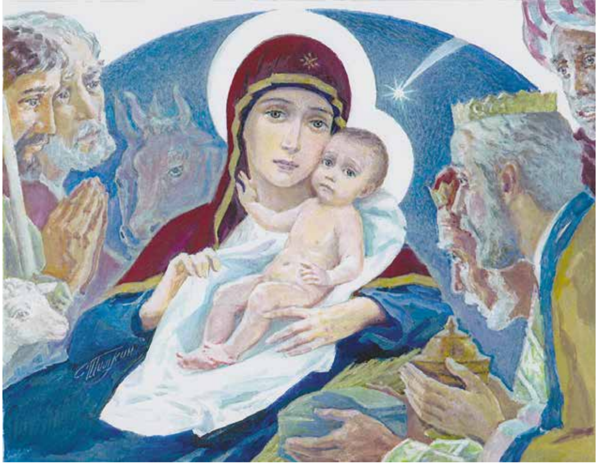
Георгий Шишкин. «Рождество Христово»

Равнины Иудеи невольно, наверное, показывали своё понятие о своих нравах в сравнениях с нравами цветущей Галилеи в своей поговорке – «легче вырастить масличный лес в Галилее, чем воспитать одно дитя в Иудее». Хлеб вырастал в Галилее в изобилии; проживать было в пять раз дешевле, чем в Иудее. Там было около 240 деревень и городов – в каждом таком поселении не менее 15 тысяч жителей. На Галилейском озере с его несравненной красотой, с богатыми деревьями трудилось немало рыбаков... В Галилее сама природа направляла к размышлениям и молитве. Человек там неохотно впадал в болезненный фанатизм... Там всё было легко и просто. Там возрастал Человек.