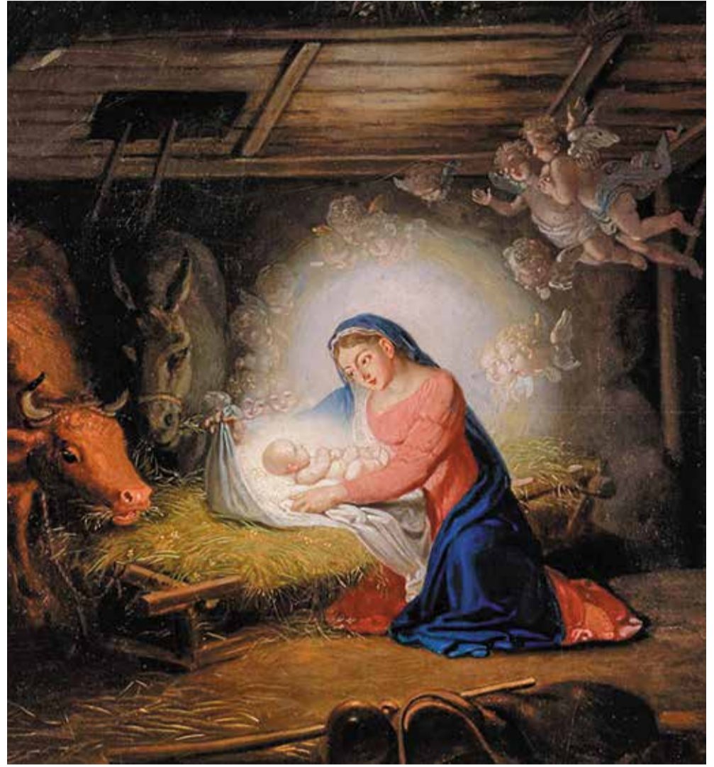
Владимир Боровиковский «Рождество Христово». Фрагмент

склонившиеся перед Божественным Младенцем. Они с богатыми дарами только прибыли с Востока.