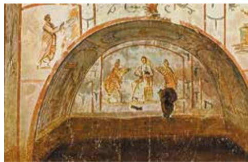
Ясли Рождества в катакомбах Сан Себастьяно

Считается, что истоки иконографии Рождества Христова восходят к изображениям в катакомбах и на саркофагах.