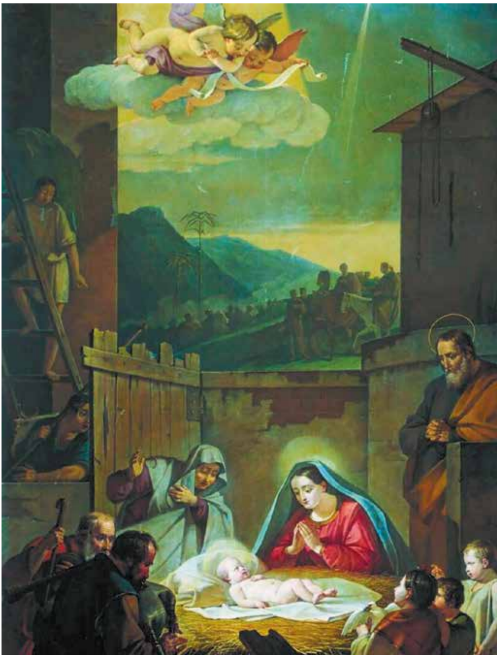
Василий Шебуев . «Рождество Христово»