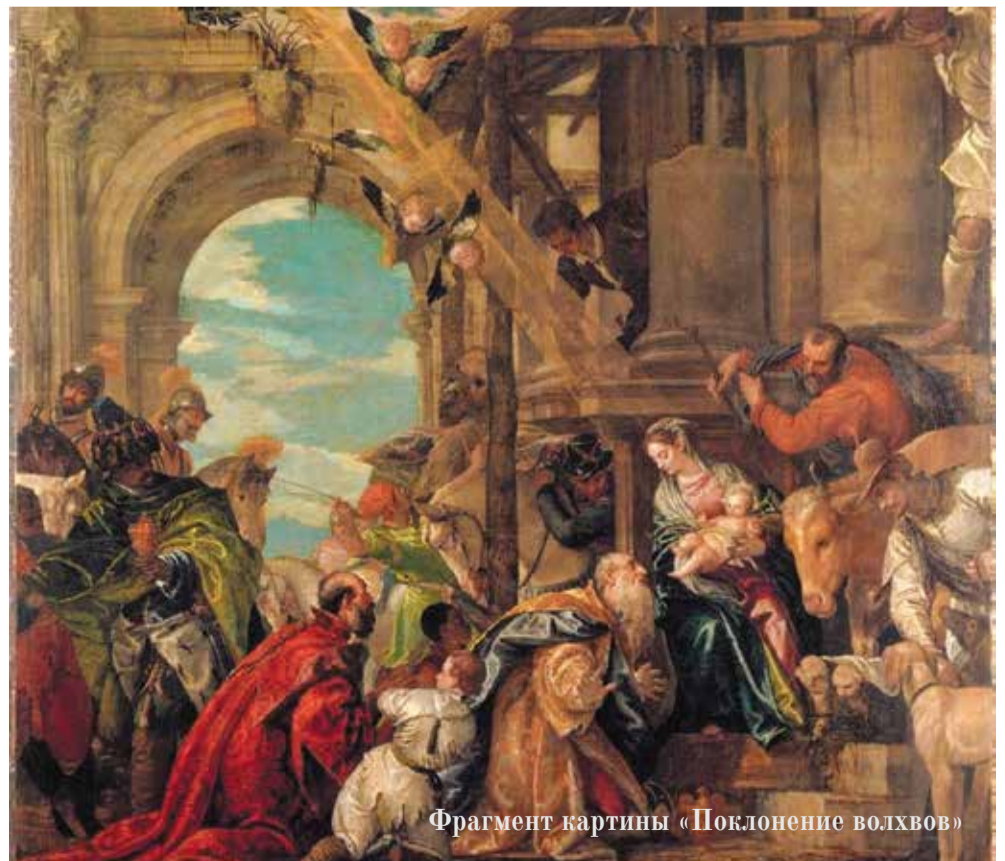
Фрагмент картины «Поклонение волхвов»

В эпоху Возрождения художники часто изображали именно дом, в котором Пресвятая Дева Мария родила Младенца Христа. Дом у Веронезе выглядит обветшалой постройкой и символизирует Ветхий Завет, который должен заменить на Новый завет явившийся на землю Христос. На заднем плане возвышаются величественные развалины с триумфальной аркой – указание на Рим. А прямо перед нами – мудрые волхвы со свитой, в смирении