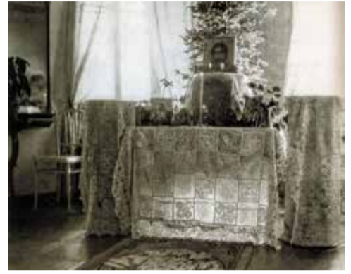
Столик, на котором служили обедни, украшенный к Рождеству 1917 года. Покрывала вышиты Государыней Александрой Федоровной

Государыня Александра Федоровна писала Софии Буксгевден: